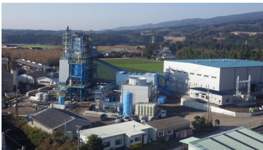
(宮崎森林発電所 全景写真)