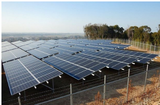
実際に再生したメガソーラー(大分県豊後高田市)

特別高圧の大型ソーラー、自家消費型、営農型など、すべてのスタイルの太陽光発電所の建設に対応